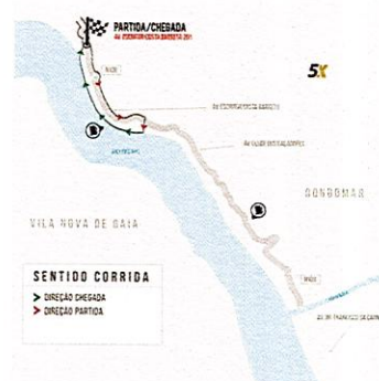
Caminhada de 5 Km

A Meia-Maratona 21 Km e a Mini-Maratona 10 km em estrada é destinada a atletas federados e não federados de ambos os sexos e dos seguintes escalões etários: