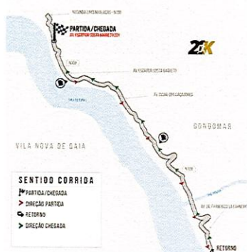
Meia-Maratona 21 Km

A Meia-Maratona 21 Km tem a partida e chegada na estrada N108 nas coordenadas 41°08'23.1"N, 8°34'18.1"W - Avenida Escritor Costa Barreto 201, parte em direção a Foz de Sousa, faz o retorno na Av. Dr. Francisco Sá Carneiro e segue novamente pela estrada N108 até á Avenida Escritor Costa Barreto 201 até a meta.