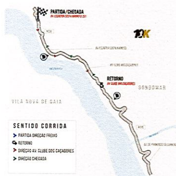
Mini-Maratona de 10 Km